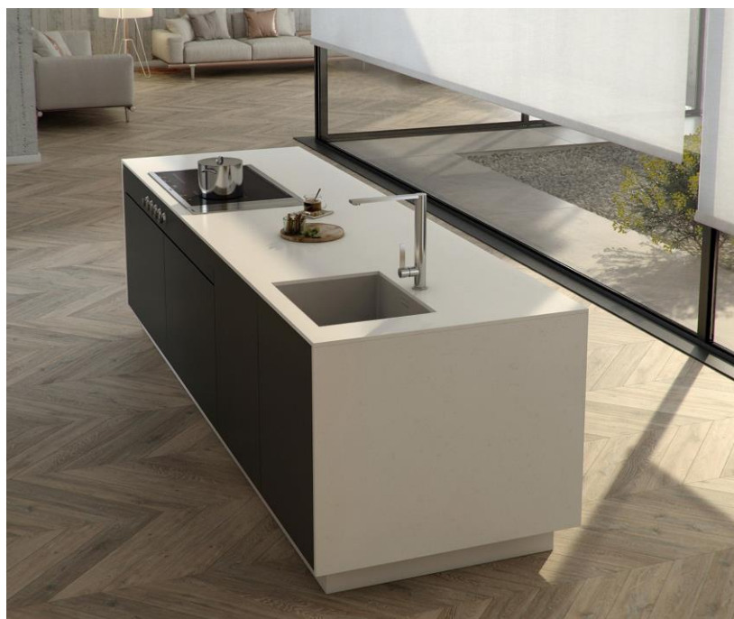
Ladda ner bilder på Silestone Miami Vena

Miami Vena är en naturlig, solid färg som lanseras i den berömda Silestone® Nebula-serien. Den är inspirerad av universums sk. nebulosor som bidrar med nya effekter av rörelse och djup.