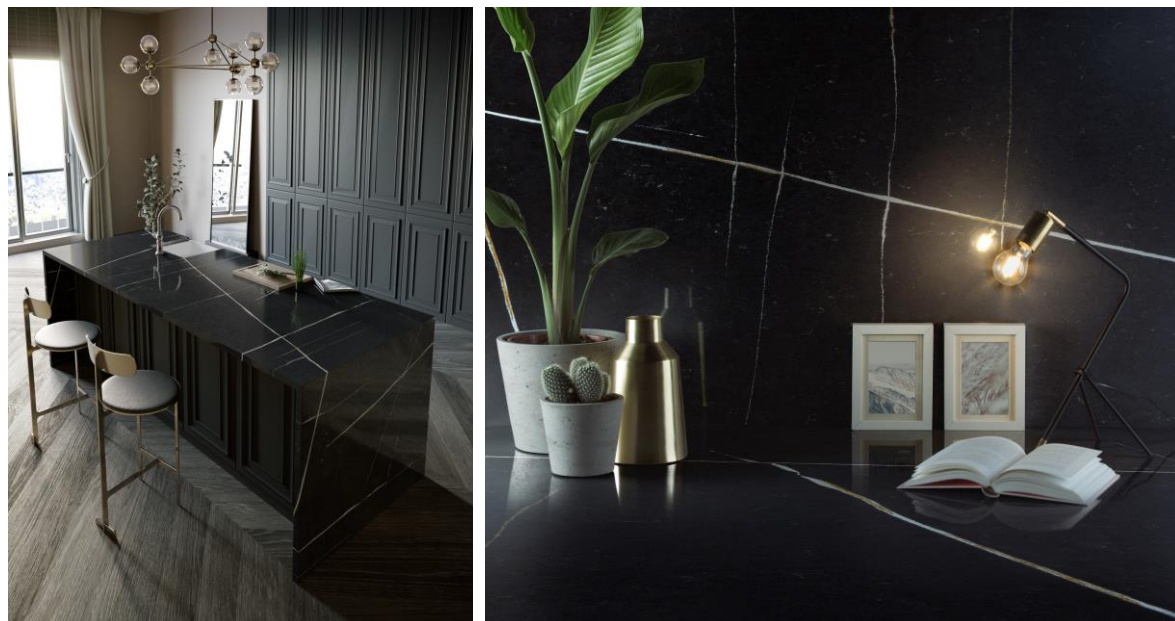
Silestone Eternal Noir Ladda ner bilder på Et. Noir

Som fallet med de andra färgalternativen som ingår i Silestone® Eternal-kollektionen, är marmorutseendet, charmen med natursten och historien och känslan hos sten också grunden i denna nya färg.